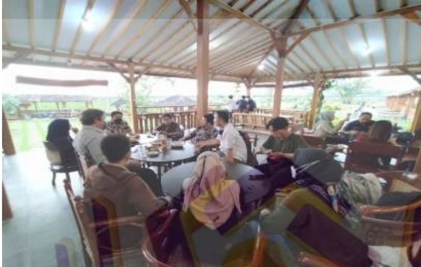
Gambar daily scrum