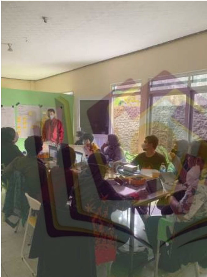
Gambar Sprint Review